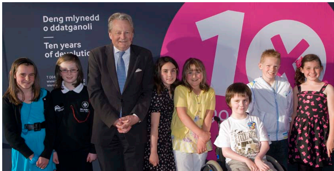
Y Llywydd yn cyfarfod pobl ifanc ar 12 Mai 2009

I ddathlu deng mlynedd ers cynnal Cyfarfod Llawn cyntaf Cynulliad Cenedlaethol Cymru, cynigwyd y cyfle i blant o bob rhan o Gymru a anwyd ar 12 Mai 1999 ddathlu eu pen-blwyddi mewn steil yn y Senedd. Ymunodd plant o Gaerfyrddin, Neyland, Wrecsam, Abertawe, Caerdydd, Casnewydd a Thywyn ag Aelodau'r Cynulliad a chyn Aelodau'r Cynulliad i nodi'r diwrnod arbennig hwn.